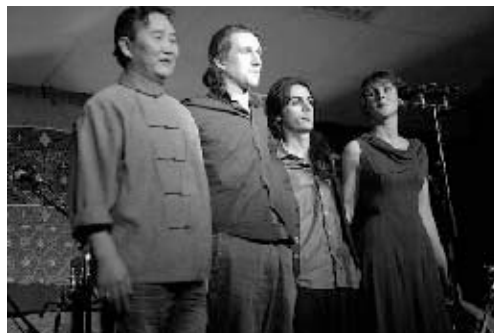
Meïkhâneh + invité